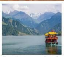
ช่องเรือทะเลสาบเทียนฉือ