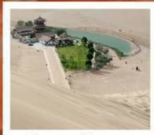
เป็นทรายหิมชซาซาน