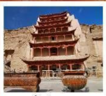
ถ้ำม้อเถา