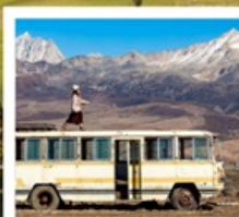
เมืองลอยฟ้าเก๋ตี้ลามู่

ทัวร์คุณธรรม ไม่ลงร้านช้อปปิ้ง ไม่ขายออฟชั่น