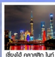
เซี่ยงไฮ้ คลาสสิก ไท่