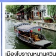
เมืองโบราณหนานสวิน