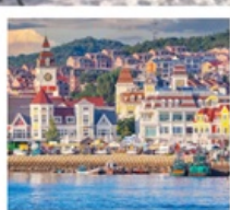
ท่าเรือประมงเขียนโก๋

เรือลิววิส / ย่านฮั่นเล่อฟาง / ถนนฮั่วจวิปา ท่าเรือประมงเขียนโก๋ / ย่านฮงโหว่ 1920 / ถนนโบราณเฉาหยาง หอคอยกาลเวลา / ชายหาดจินซา / รูปปั้นปลาวาฬ / หาดทรายซาจื่อโหว่ หาดไซเบอร์ NO.3 / โรงงานเบียร์ชิงเต่า / โบสถ์ St. Emil ถนนคนเดินไต้ตง / สะพานจันเฉียว / จัตุรัส 54 / ห้าง MIXC