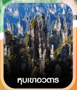
หุบเขาอวตาร

คอนเฟิร์ม ออกเดินทาง ทุกพีเรียด 2 ท่านขึ้นไป