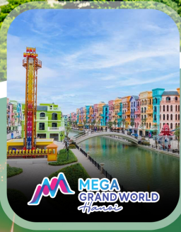
ไฮไลท์ทั้งหมด

✈️ คอนเฟิร์มออกเดินทาง ทุกพีเรียด 2 ท่านขึ้นไป