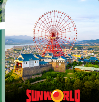
SUNWORLD HA LONG