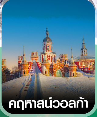
คฤหาสน์วอลก้า