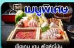
เช็ทซาฮู ซาฮู สไตล์ญี่ปุ่น

พำนักที่ Amuratsubo 1 คืน / อาหาร 12 มื้อ / เครื่องดื่มไม่มีแอลกอฮอล์ ฟรี! / ฟรี! น้ำดื่ม