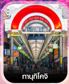
ทามุกิโคจิ