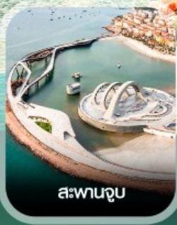
สะพานจูบ