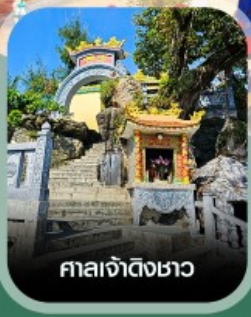
ศาลเจ้าดิงซาอว

เช็คอินสวนสนุก VinWonders ใหญ่ที่สุดของเวียดนาม นั่งกระเช้าชมวิวข้ามทะเล สวนสนุกฮอนเท็ม ตื่นตาอควาเรียมรูปเต่า อาณาจักรสัตว์น้ำ