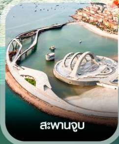
สะพานจูบ

✈️ คอนเฟิร์ม ออกเดินทาง ทุกพีเรียด 2 ท่านขึ้นไป