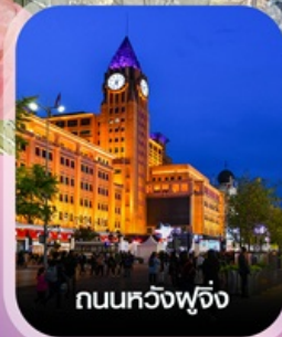
ถนนหัวขี้หมู

✈️ คอนเฟิร์ม ออกเดินทาง ทุกพีเรียด 2 ท่านขึ้นไป