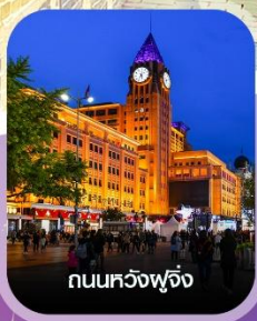
ถนนหวงฝูจิ่ง