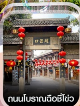
ถนนโบราณฉือชี่โฮ่ว