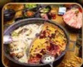
อาหารจีนเริ่มต้น WUKANG MANSION