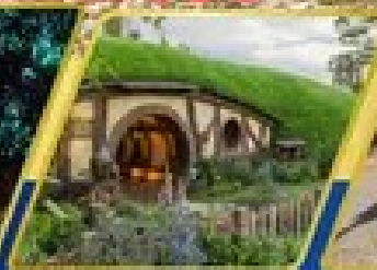
หมู่บ้านฮ็อบบิต