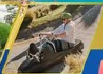
เล่นลuge ที่กรีนสทาวน์

AUCKLAND / ROTORUA / CHRISTCHURCH FOX GLACIER / FRANZ JOSEF / QUEENSTOWN พิกจ็อคแลนด์ 2 คืน / โรโตรัว 1 คืน / พิกโครสต์เชิร์ช 2 คืน พิกฟรานซ์โจเซฟ 1 คืน / คริสต์ทาวน์ 2 คืน