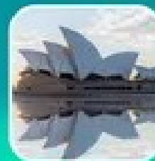
ซิดนีย์ โกลด์โคส