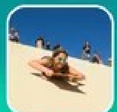
เล่นกระดานทรายจากขบวนเครื่องบินทรานสูงชัน