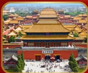
เขื่อนมรดกโลก พระราชวังกู้กง