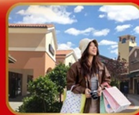
อิสระช้อปปิ้ง BEIJING OUTLET