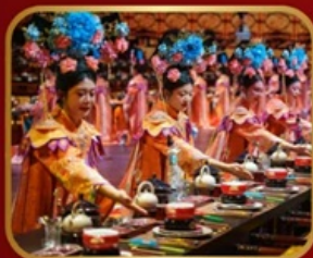
กัศัตการวังหลวง YU XIAN DU