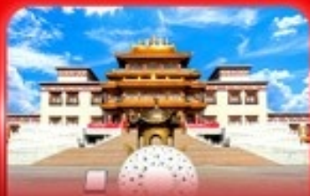
วัดพระโพธิสัตว์จุลาน