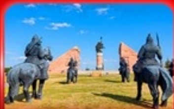
สวนสาธารณะเจงกิสข่าน