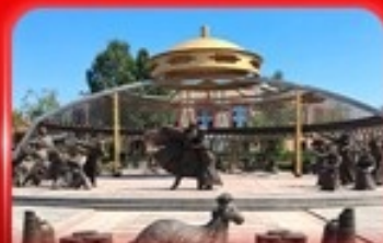
สวนวัฒนธรรมการแต่งจานจอร์ดอส