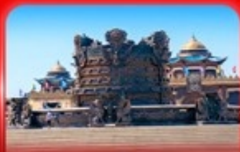
ศูนย์วัฒนธรรม มองโกเลีย หยวนหลิว