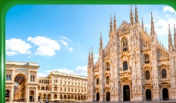
มหาวิหารดูโอโมแห่งมิลาน