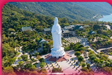
องค์กวนอิม วัดหลินอึ้ง