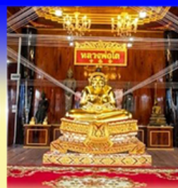
วัดเกษมสรณาราม