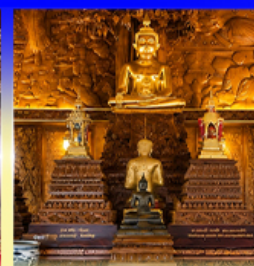
วัดบางแคน้อย