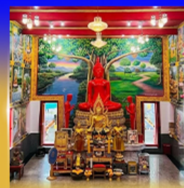
วัดบางพรหม