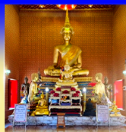
วัดทองคั้ง