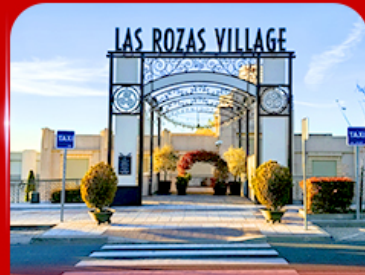
Las Rozas Village เอากีเลียน