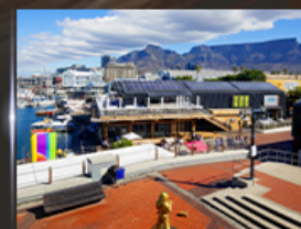
ท่าเรือ V&A waterfront