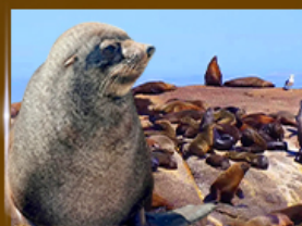
ส่องเรือชมฝูงแมวน้ำ Seal Island