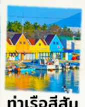
ท่าเรือสีสัน