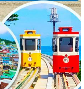
นั่งรถไฟปู๊กบีก

ราคานี้รวมค่าภาษีน้ำมัน + ค่าภาษีสนามบิน ** ปรับขึ้น ณ วันที่ 1 เม.ย. 69 เรียบร้อยแล้ว **