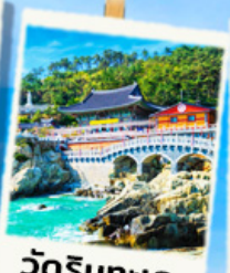
วัดริมทะเล