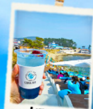
คาเฟ่ริมทะเล