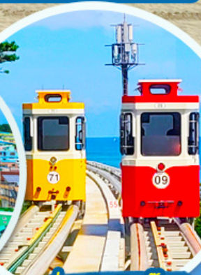
นั่งรถไฟปู๊กบีก

ราคานี้รวมค่าภาษีน้ำมัน + ค่าภาษีสนามบิน ** ปรับขึ้น ณ วันที่ 1 เม.ย. 69 เรียบร้อยแล้ว **