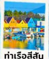
ท่าเรือสีสัน