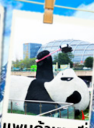
แพนด้าเซลฟี่