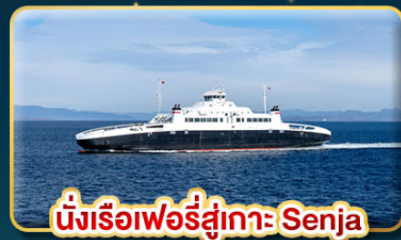
นั่งเรือเฟอร์รี่สู่เกาะ Senja