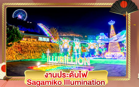
งานประดับไฟ Sagamiko Illumination