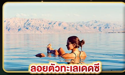
ลอยตัวทะเลเดคซี