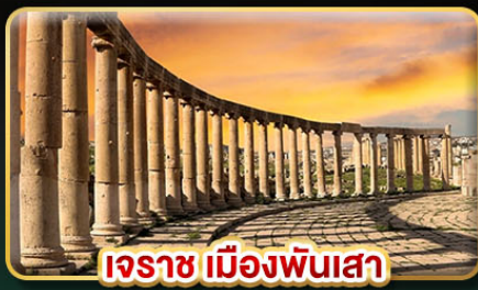
เระซ เมืองพันเสา