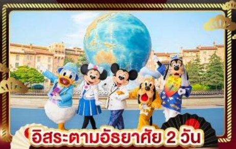
อิสระตามอริยาศัย 2 วัน