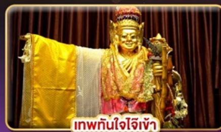
เทพทันใจเจ้า