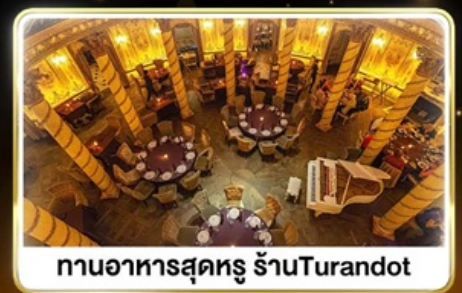
งานอาหารสุดหรู ภัตตาคาร Turandot