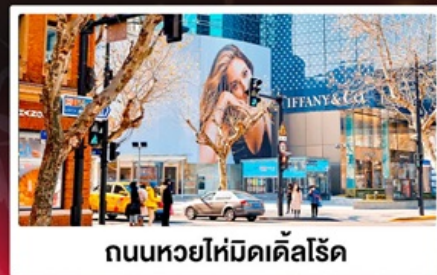
ถนนหวยไห่มีดเคิ้ลโรด