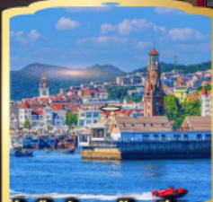
ท่าเรือประมงต้าเหลียน