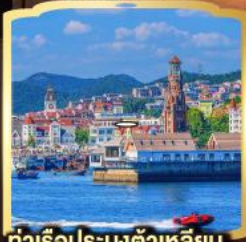
ท่าเรือประมงต้าเหลียน