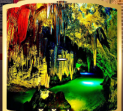
ถ้ำน้ำเปิ่นซี