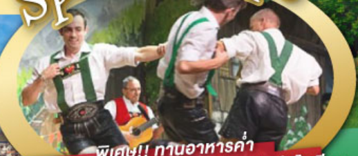
พิเศษ!! ทานอาหารค่ำ พร้อมชมการแสดงดนตรีพื้นเมืองสไตล์โรเลียน และเยือนเมืองอูเทรคต์ สีสันใหม่เนเธอร์แลนด์

ไฮไลท์โปรแกรม • เยือนเมืองแห่งแคว้นบาวาเรีย และ ทิโรล • สุกสนานเหมืองเกลือเบียร์เทสกาเดิน • เข้าชมปราสาทนอยชวานสไตน์ • เดินเล่นจัตุรัสโรเมอร์ ซอปปิง Zeil Street • ถ่ายรูปมุมสวยของหมู่บ้านอัลสติก • ซิล่า ไปในเมืองซาลสบูร์ก บ้านเกิดโมสาร์ท • ล่องเรือหมู่บ้านทีธูร์น และ ล่องเรือชมนครอัมสเตอร์ดัม • ซอปปิงจุ้ยย่านดัมสแควร์และเดินเล่นย่านโคมแดง 25 ก.ย. - 04 ต.ค. 69 09-18, 16-25 ต.ค. 69 22-31 ต.ค. 69 / 06-15 พ.ย. 69 29 ธ.ค. 69 - 07 ม.ค. 70 * ปีใหม่ *