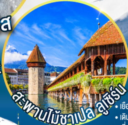
สะพานไม้ชาเปลลูเซิร์น