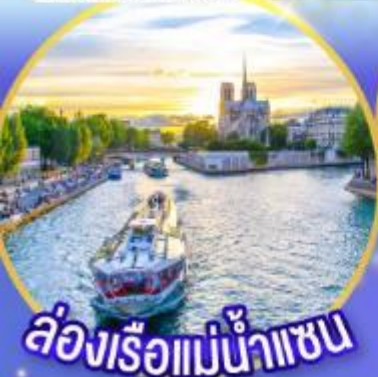
ล่องเรือแม่น้ำเซน