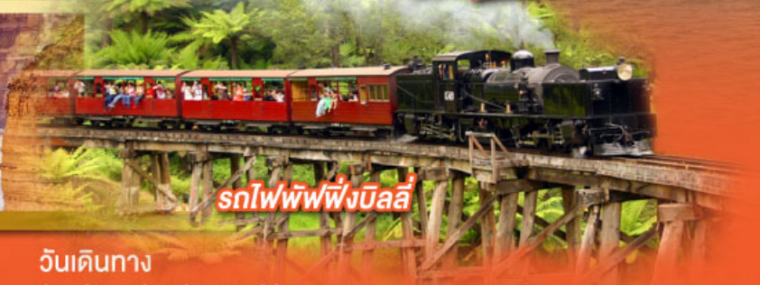
รถไฟพuffingบิลลี่