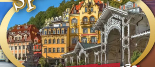
ชมสถาปัตยกรรมคลาสสิก เมือง คาร์โลวี วารี