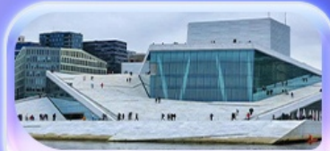
โอเปร่าเฮาส์

07-15 ต.ค.69 / 16-24 ต.ค.69 13-21 พ.ย. 69 / 04-12 ธ.ค. 69 25 ธ.ค. 69 - 02 ม.ค. 70 (ปีใหม่)