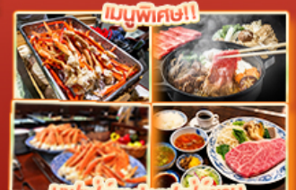
บุฟเฟ่ต์ญี่ปุ่น สเต็กคอบะ