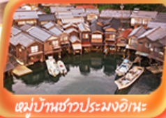
หมู่บ้านชาวประมงอิเะ