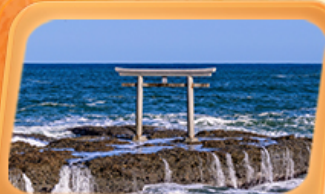
ศาลเจ้าโออาไรโอชิซาทิ

แพคเกจทัวร์ "ฟูจิซัง" ที่หมู่บ้านโอชิโนะ อัทโท สวนโออิชิปาร์ค ที่เที่ยว Unseen นั่งกระเช้าชมวิวภูเขาฟูจิ ทะเลเจ้าโออาไรโอชิซาทิ เสาโทริอิริมทะเล อลังการโบสถ์แปดชั้น น้ำตกเคงอน ศาลเจ้านิกโกโทโชกุ เสริมมงคล วัดพระใหญ่ซึคุ ไดบุคสี ห้ามพลาตโคมแดงยักษ์ วัดอาซากุสะ อิมพอร์ตตลาดปลาโทโยสุ ทุกกายแนว 3D ย่านชิจูกุ ซุปปิ้งจุใจย่านดังชิบูย่า