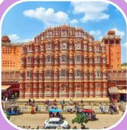
พระราชวัง แห่งสายลม