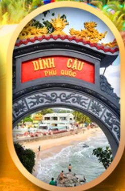
ศาลเจ้าติงเกา