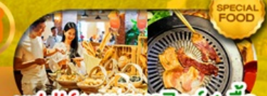
บุฟเฟ่ต์บนบานาฮิลล์ 1 มื้อ และ บุฟเฟ่ต์ บาบิวบิงย่าง เดินทาง มี.ค. - ต.ค. 69