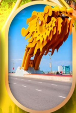
สะพานมังกรดาบิง