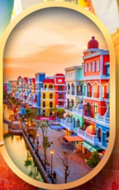
เวนิสแห่งเวียดนาม