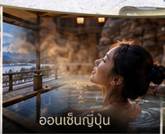
ออนเซ็นฟูจิฟู