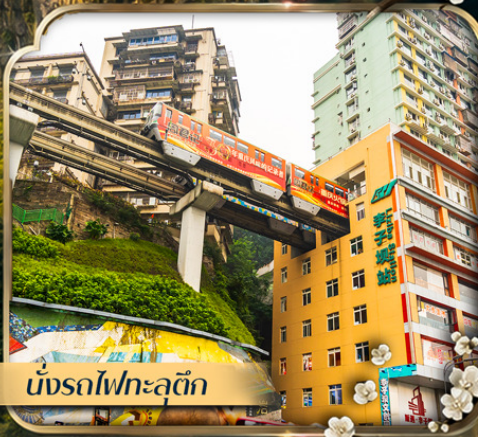
นั่งรถไฟกะลุดัก

✈️ คอนเฟิร์มออกเดินทาง ตั้งแต่ 10 ท่าน ขึ้นไป