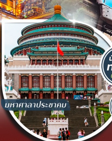
มหาศาลาประชาชน