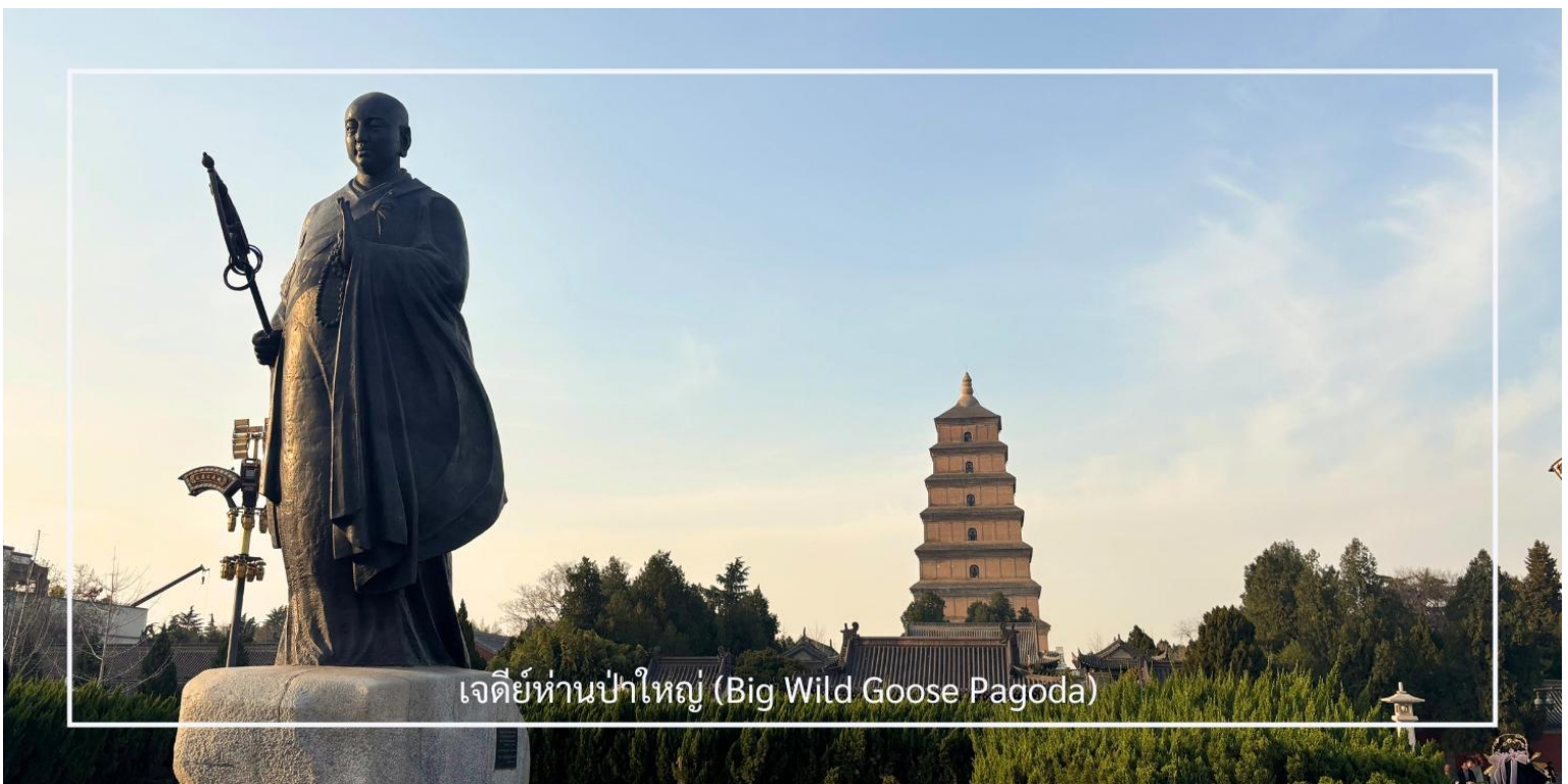
เจดีย์ห่านป่าใหญ่ (Big Wild Goose Pagoda)

นำท่านเดินทางสู่ เจดีย์ห่านป่าใหญ่ (Big Wild Goose Pagoda) ซึ่งตั้งอยู่ภายในบริเวณ วัดต้าซือเอิน (Da Ci'en Temple) สถานที่สำคัญทางพุทธศาสนาและประวัติศาสตร์ของจีน สร้างขึ้นในปี ค.ศ. 652 สมัยราชวงศ์ถัง เพื่อเก็บรักษาพระไตรปิฎกและพระธรรมคัมภีร์ที่ พระถังซำจั๋ง อัญเชิญกลับจากชมพูทวีป เจดีย์มีลักษณะทรงสี่เหลี่ยมแบบขั้นบันได สร้างด้วยอิฐเผา สะท้อนศิลปะจีนที่ผสมผสานอิทธิพลจากอินเดีย เดิมสูง 5 ชั้น ต่อมาได้รับการบูรณะจนมีความสูง 7 ชั้น (ประมาณ 64 เมตร) เป็นแบบอย่างของสถาปัตยกรรมพุทธศิลป์ยุคราชวงศ์ถังที่เรียบง่ายแต่ทรงพลัง ปัจจุบันเจดีย์แห่งนี้ถือเป็นสัญลักษณ์ทางวัฒนธรรมของเมืองซีอานและสถานที่ท่องเที่ยวยอดนิยมที่ควรมาเยือน