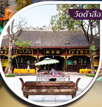
วัดต้าสื้อ