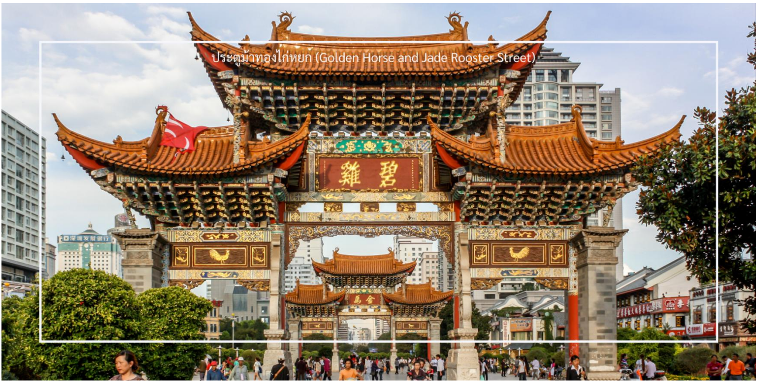
ประตูม้าทองไถ่หยก (Golden Horse and Jade Rooster Street)

นำท่านอิสระช้อปปิ้งบน ถนนคนเดินหนานผิง ถนนคนเดินที่คึกคักและเต็มไปด้วยร้านค้าแฟชั่น ของใช้ ของฝาก และสินค้าพื้นเมืองหลากหลายประเภท ท่านสามารถเลือกซื้อสินค้าและของที่ระลึกตามอัธยาศัย พร้อมเพลิดเพลินกับบรรยากาศเมืองคุนหมิงในย่านการค้าที่เต็มไปด้วยสีสัน อีกทั้งได้สัมผัสวิถีชีวิตของคนท้องถิ่นที่เดินเล่น ช้อปปิ้ง และรับประทานอาหารริมทาง ทำให้เป็นช่วงเวลาสนุกสนานและเป็นประสบการณ์ช้อปปิ้งที่น่าประทับใจ